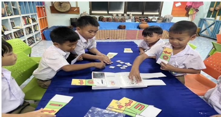
ภาพที่ 1 กิจกรรมการสอนโดยใช้วิธีการสอนแบบโฟนิกส์

จากตารางที่ 1 พบว่า การทดสอบกำหนดให้นักเรียนที่ผ่านเกณฑ์ต้องมีคะแนนตั้งแต่ร้อยละ 80 ขึ้นไป และเกณฑ์จำนวนนักเรียนผ่านเกณฑ์ไม่น้อยกว่าร้อยละ 80 พบว่า ผลจากการทดสอบวัดทักษะการออกเสียงพยัญชนะท้ายคำภาษาอังกฤษตัว ‘P’ โดยใช้วิธีการสอนแบบโฟนิกส์ จำนวน 35 คน ซึ่งเป็นนักเรียนกลุ่มตัวอย่าง มีนักเรียนที่ผ่านเกณฑ์จากการทำแบบทดสอบวัดความสามารถในการออกเสียงพยัญชนะท้ายคำภาษาอังกฤษตัว ‘P’ จำนวน 31 คน คิดเป็นร้อยละ 88.57 การทดสอบของนักเรียนทั้งชั้นมีคะแนนเฉลี่ย 15.20 คิดเป็นร้อยละ 88.57 ซึ่งสูงกว่าร้อยละ 80 ตามเกณฑ์ที่กำหนดไว้